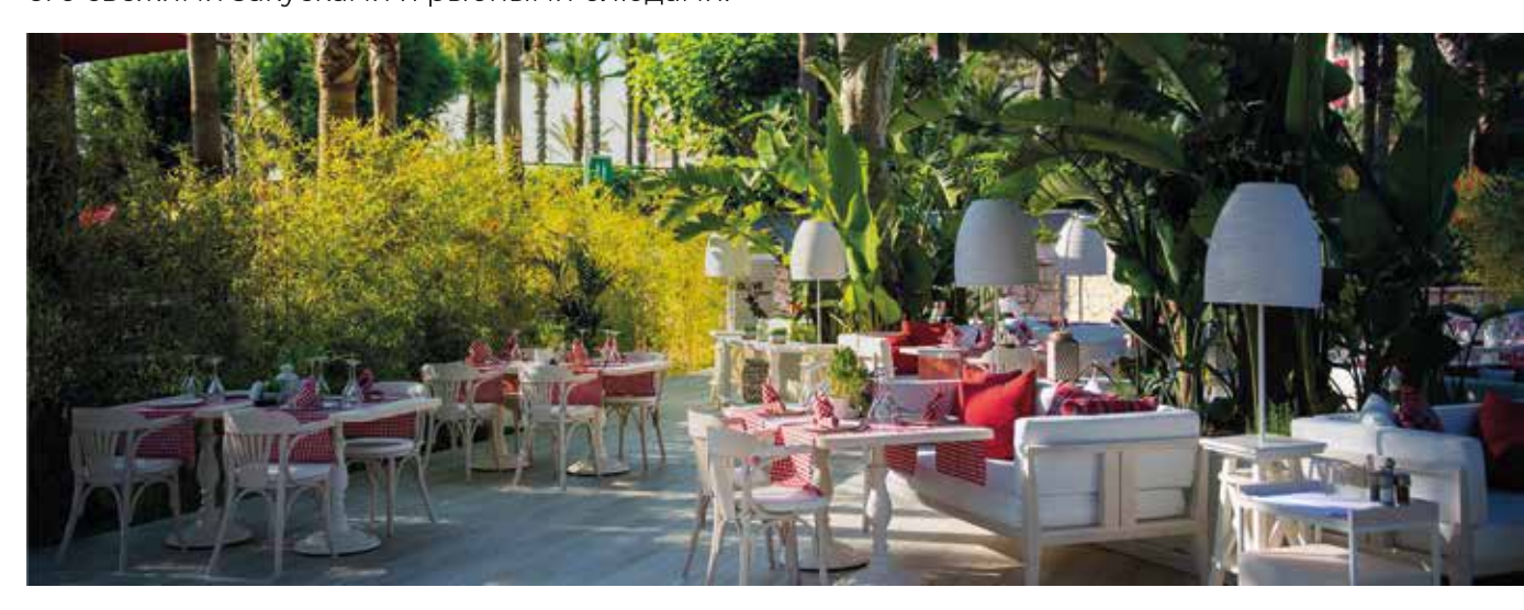
Здесь также подаётся завтрак с 08:30 до 11:00 по бронированию.

Ресторан Olive A'la Carte, гармония средиземноморской и эгейской кухонь, с уникальной атмосферой в среде природы, приглашает Вас почувствовать ритм вкуса с его свежими закусками и рыбными блюдами.