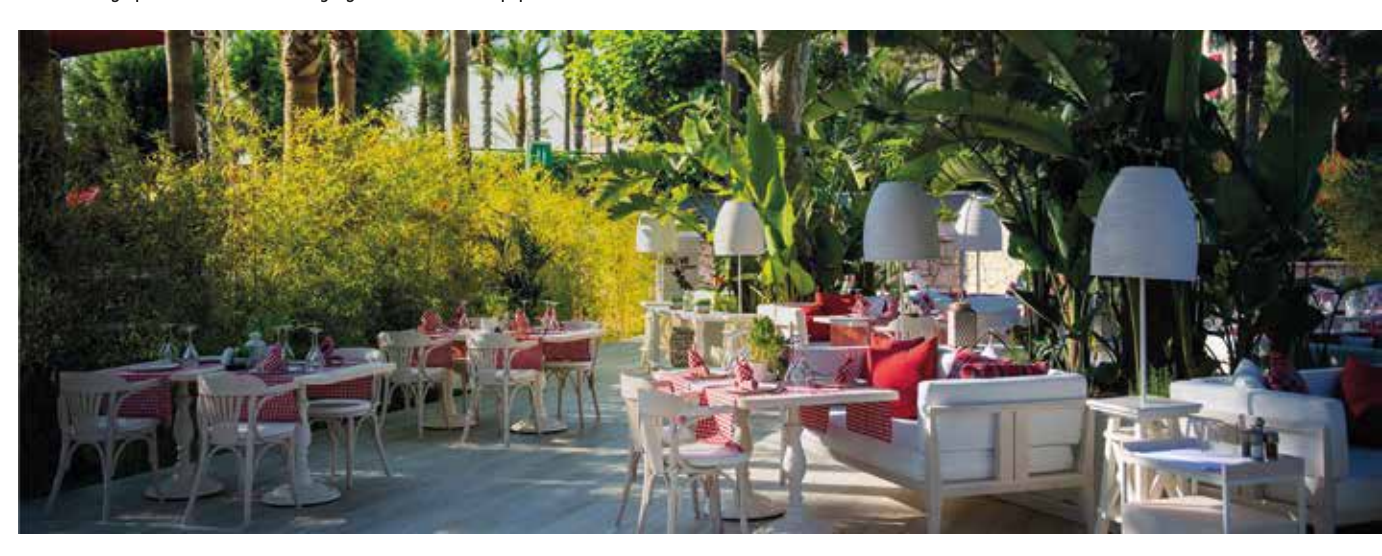
Breakfast serve between 08.30 and 11.00 reservation require.

It is very pleasant to enjoy fish and appetizers outdoors.