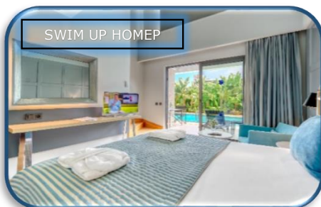
SWIM UP НОМЕР