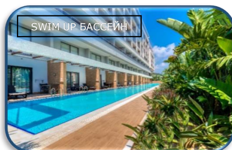
SWIM UP БАССЕЙН