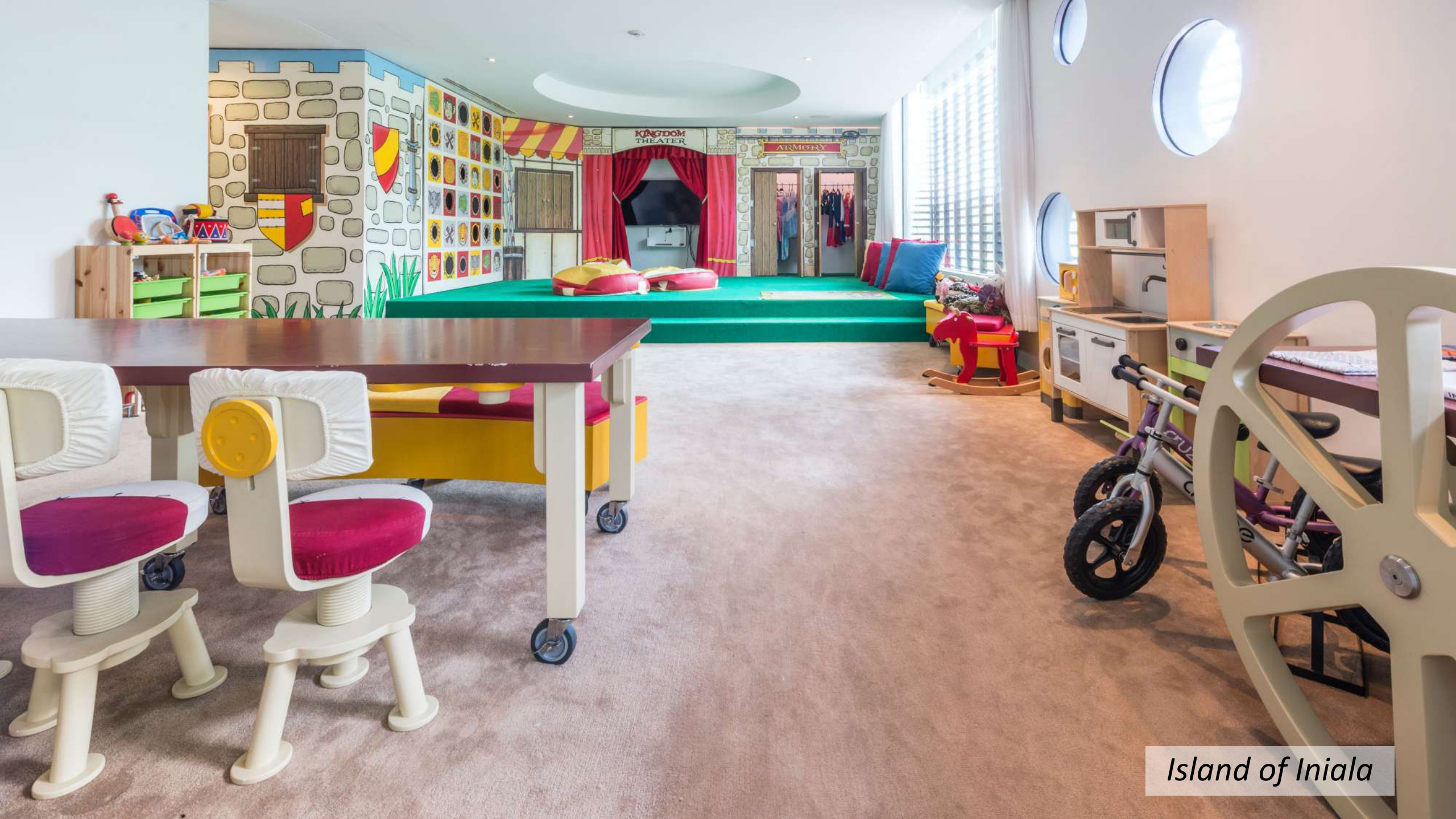
Island of Iniala