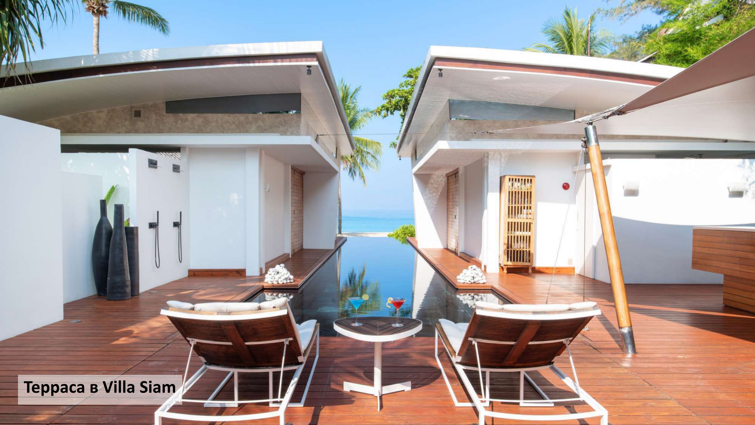
Терраса в Villa Siam