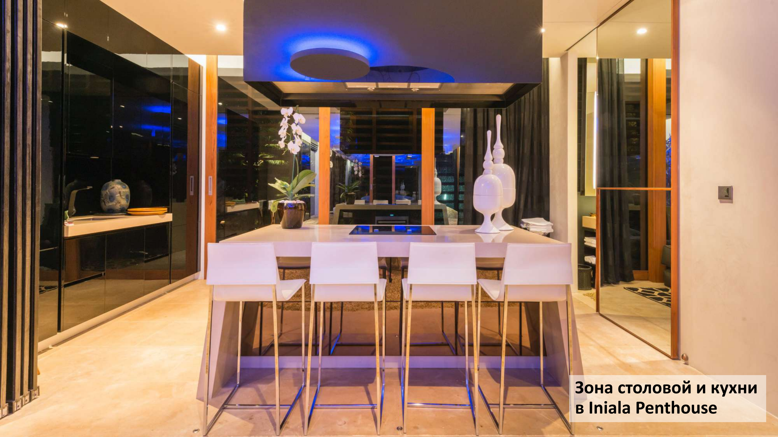
Зона столовой и кухни в Iniala Penthouse