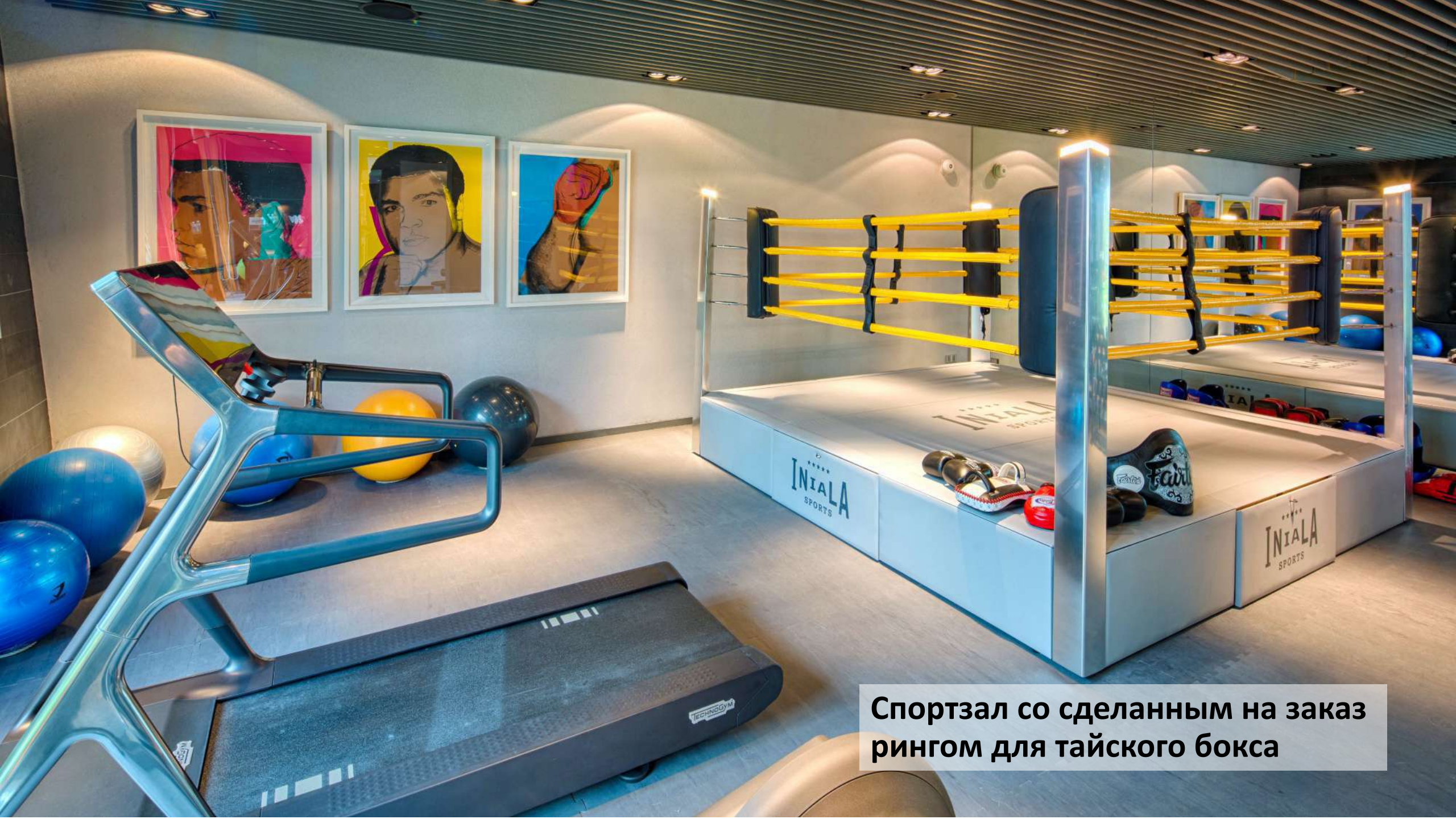
Спортзал со сделанным на заказ рингом для тайского бокса