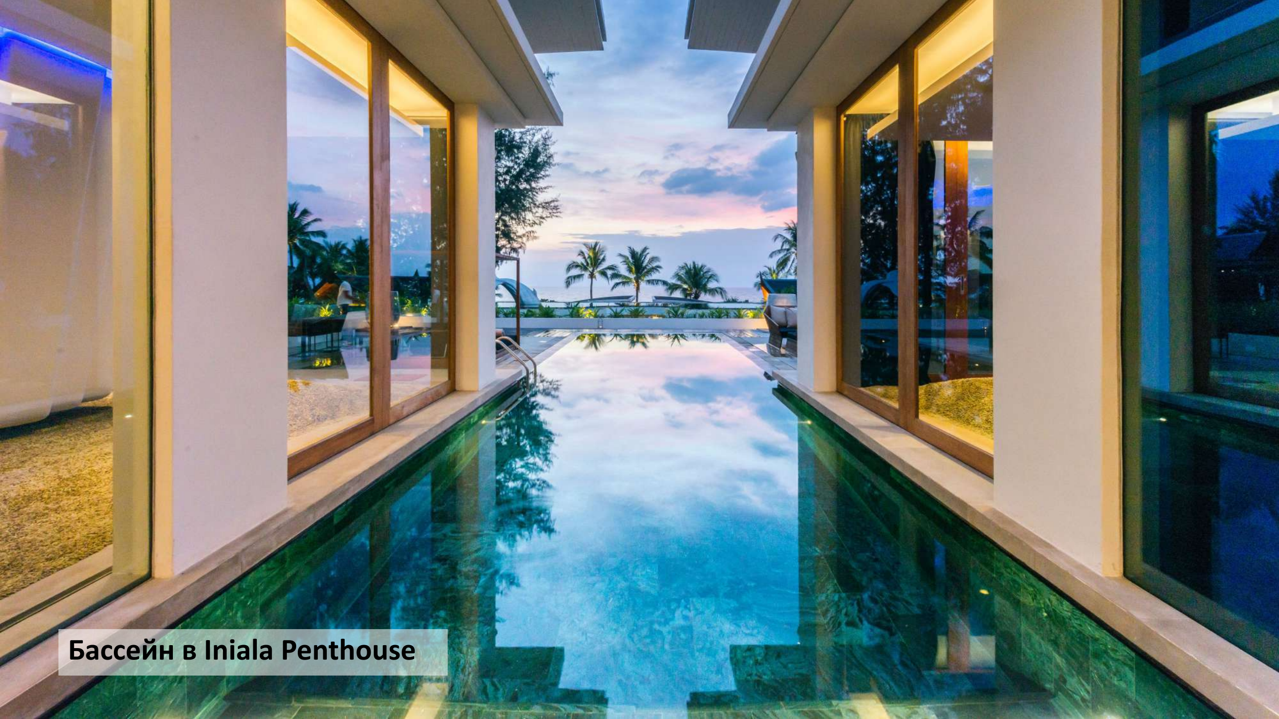
Бассейн в Iniala Penthouse