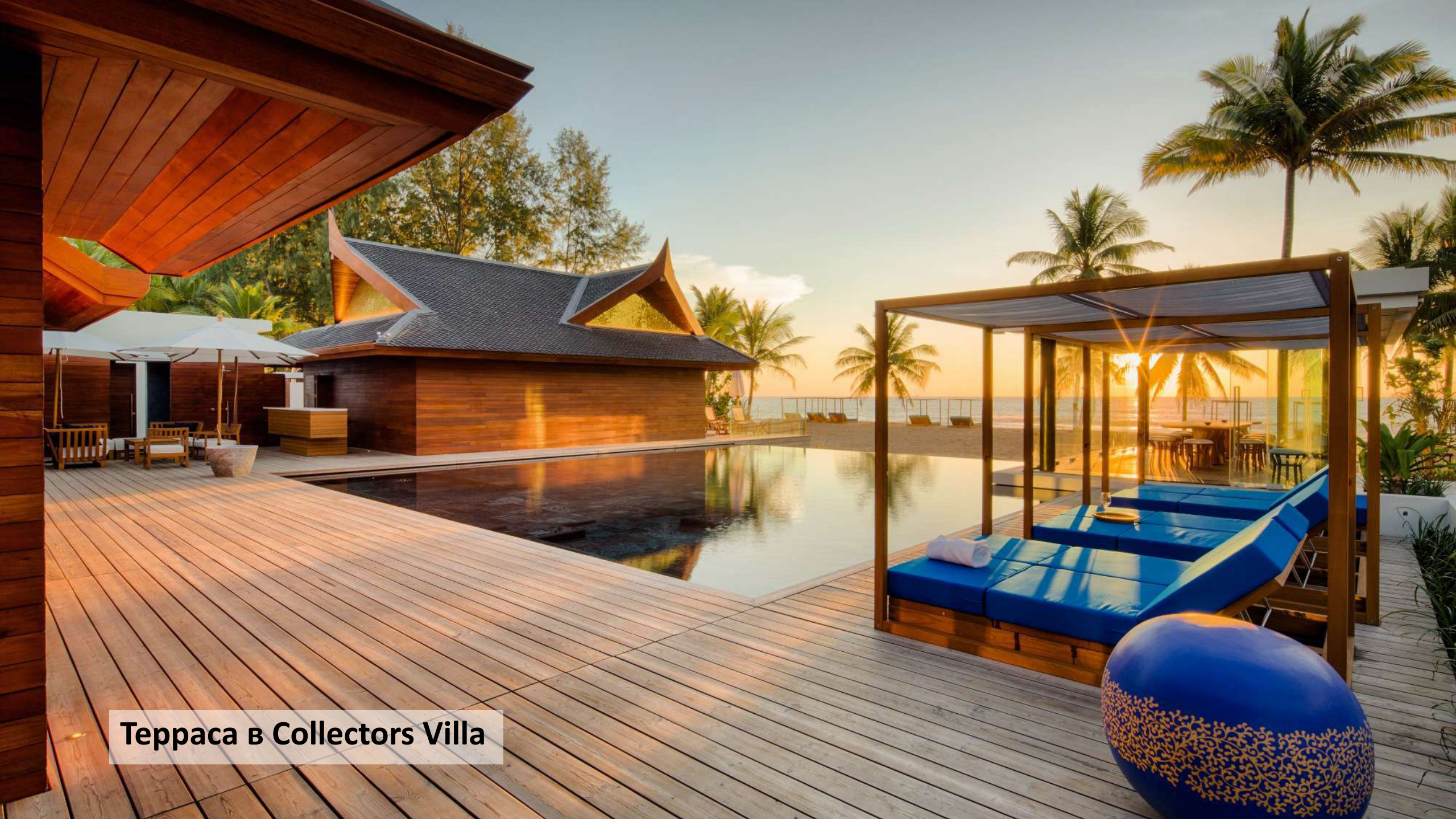
Teppaca в Collectors Villa