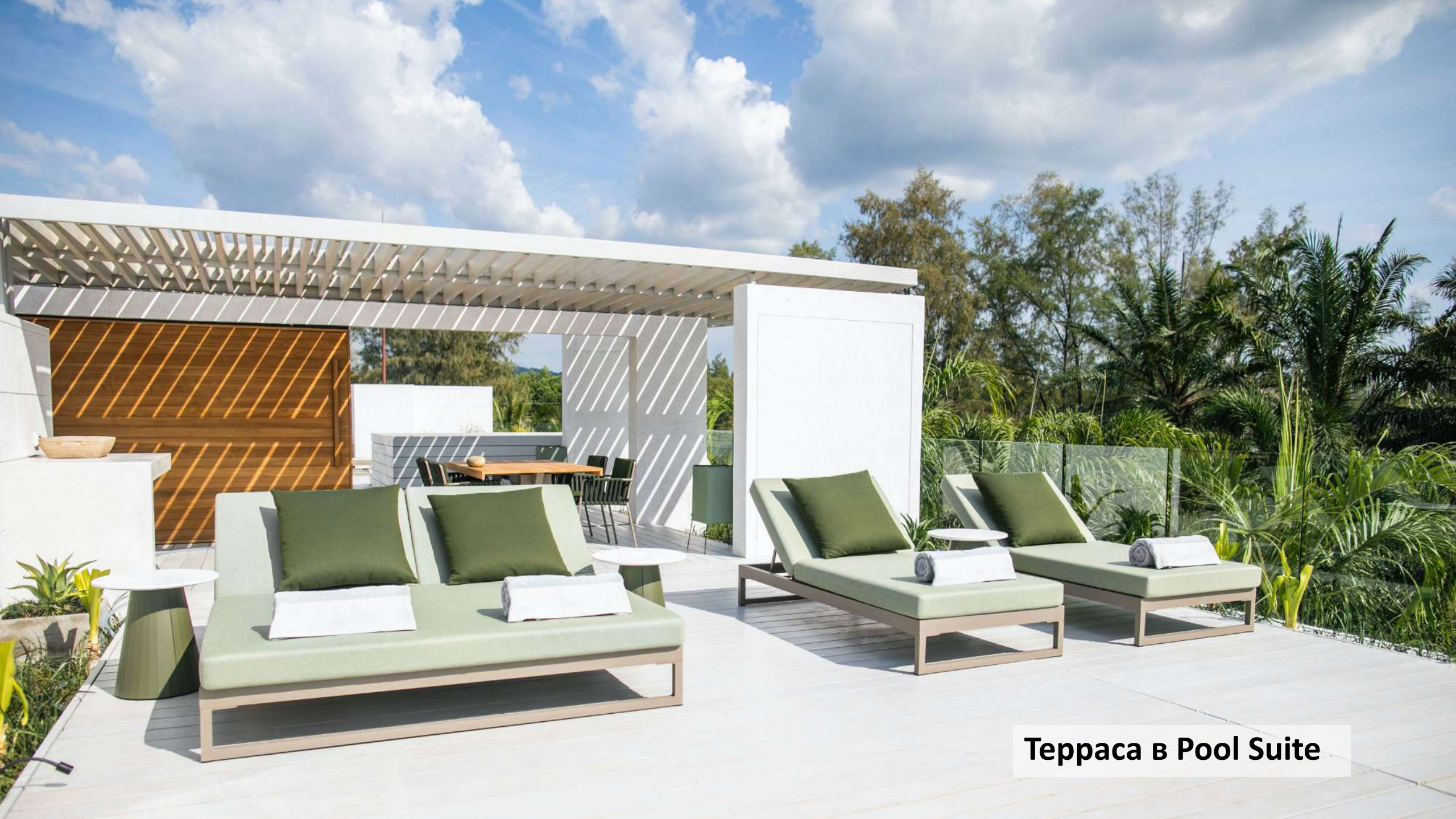
Терраса в Pool Suite