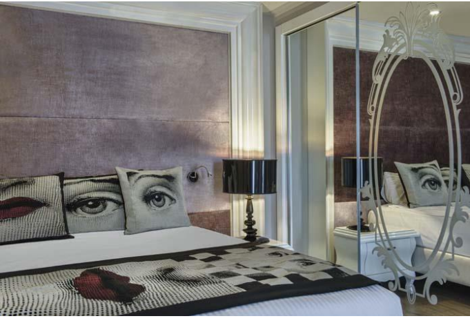
Suite Yatak Odası