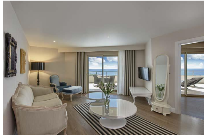
Suite Oturma Odası

Suite: Toplam 2 oda, 58 m 2 , 1 yatak odası (1 çift kişilik yatak), 1 oturma odası, 1 banyo ve terastan oluşmaktadır. Jakuzi terasta bulunmaktadır. Odalarda duş / WC, klima (merkezi, belirli saatler arasında), saç kurutma makinesi, direkt telefon, LCD televizyon (uydu yayını), müzik yayını, kasa, mini bar, zemin Laminant, kettle, çay ve kahve bulunmaktadır. Her gün oda temizliği yapılmakta olup, havlular her gün değiştirilmekte, çarşafklar ise 2 günde 1 değiştirilmektedir. Suite odalar Deniz tarafındadır. (Konaklama şekli maksimum: 2 yetişkin).