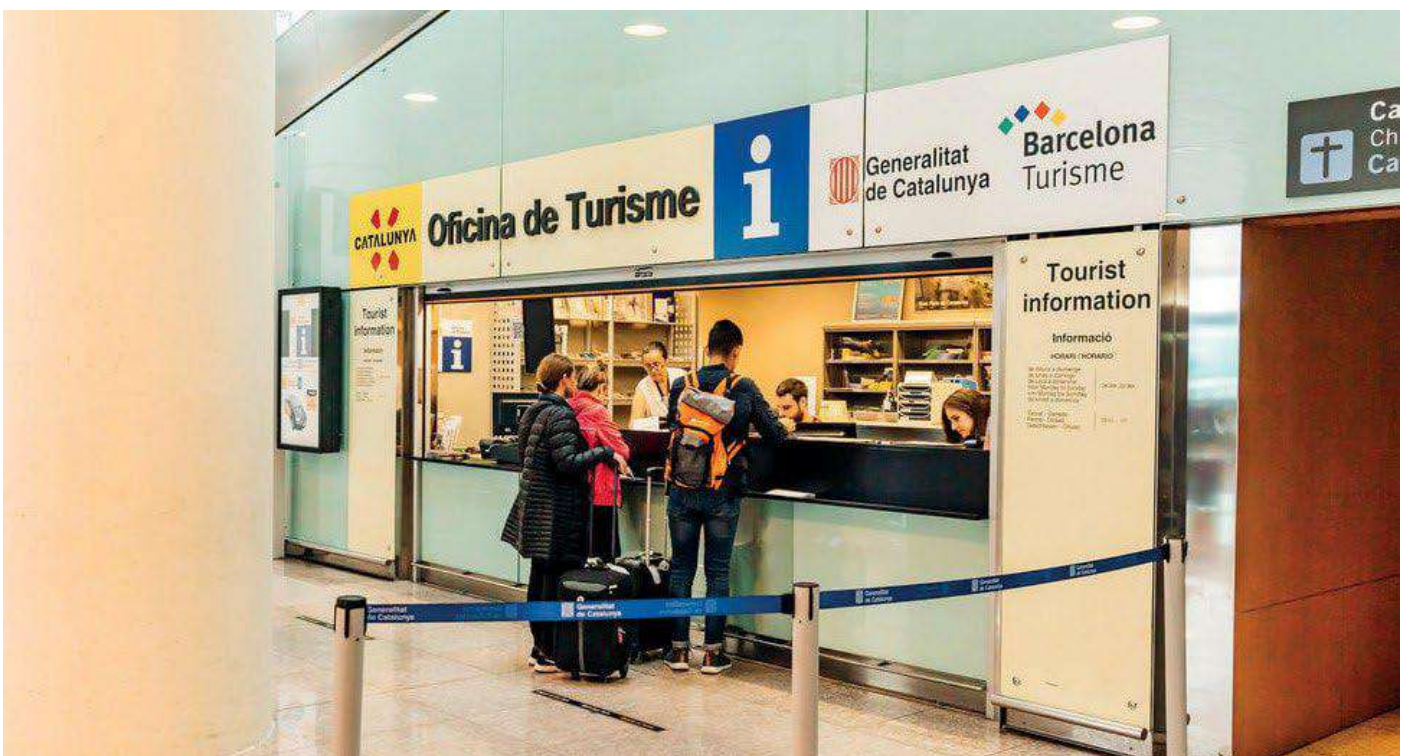
Фото місця зустрічі

У разі виникнення проблем із трансфером, прохання не залишати будівлю аеропорту та оперативно зв'язатися за черговими номерами з приймаючою компанією iTravex: +34 660 426 811, +34 660 426 808.